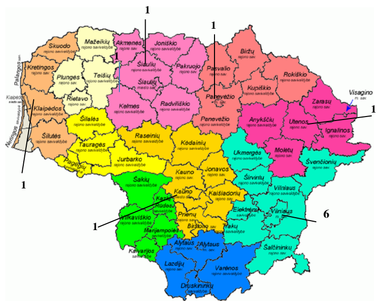
1 pav. Teritorinis investicijų projektų paskirstymas

Per šį ataskaitinį laikotarpį pritraukta 12 investicijų projektų, pagal juos numatoma sukurti 1 326 naujas darbo vietas (2014 m. I pusmetį – 13 investicijų projektų, kuriuos įgyvendinus bus sukurtos 1 423 darbo vietos). Pagal teritorinį projektų