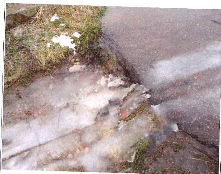
Asfalto dangos kraštų nutrupėjimas.