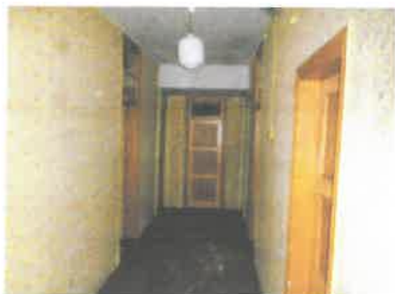
11 pav. Patalpos fragmentas