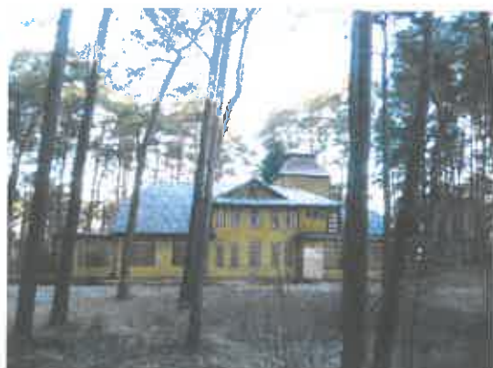
1 pav. Pastato 1A1ž fasado fragmentas

Gyvenamojo namo 1A1ž unikalus Nr. 5293-2000-8014 esančio Kauno r. sav. Kačerginės sen. Kačerginės mstl. P. Mašioto g. 12, fotonuotraukos