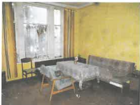
7 pav. Patalpos fragmentas

Gyvenamojo namo 1A1ž unikalus Nr. 5293-2000-8014 esančio Kauno r. sav. Kačerginės sen. Kačerginės mstl. P. Mašioto g. 12, fotonuotraukos