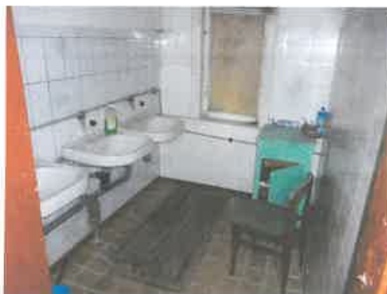
4 pav. Patalpos fragmentas