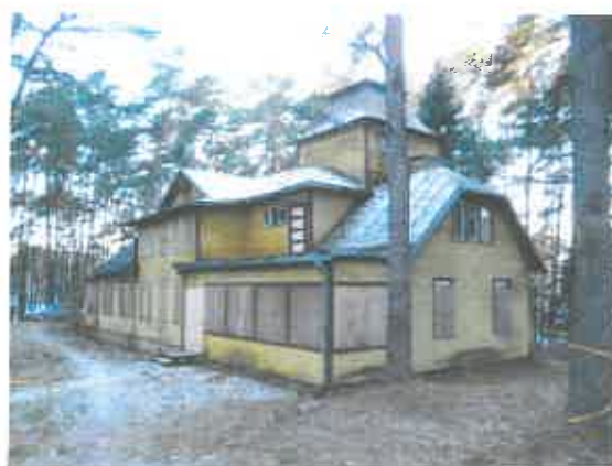
2 pav. Pastato 1A1ž fasado fragmentas