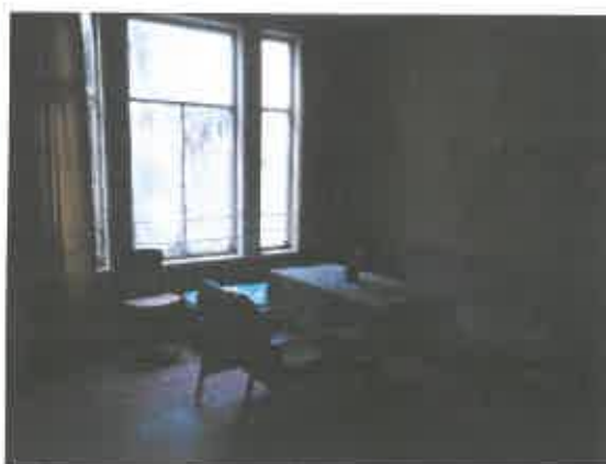
12 pav. Patalpos fragmentas