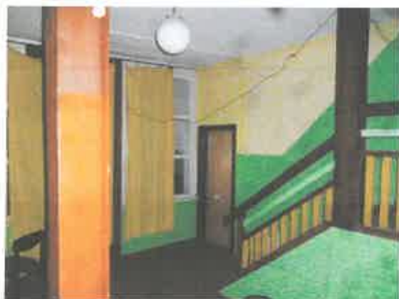
3 pav. Patalpos fragmentas