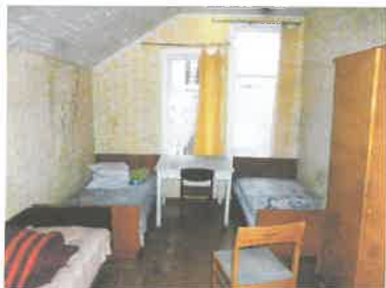
9 pav. Patalpos fragmentas