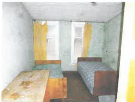
8 pav. Patalpos fragmentas