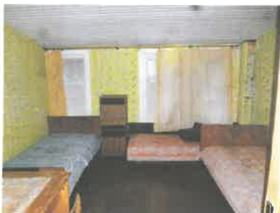
10 pav. Patalpos fragmentas