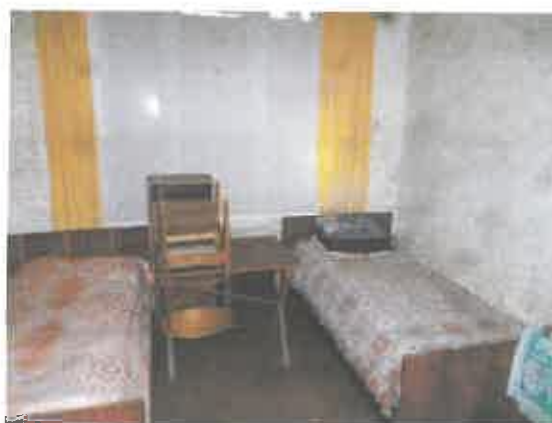
6 pav. Patalpos fragmentas