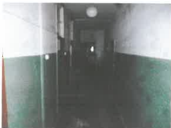
5 pav. Patalpos fragmentas