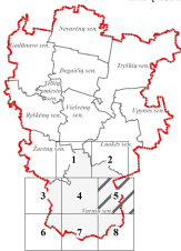
LAPŲ IŠDĖSTYMO SCHEMA