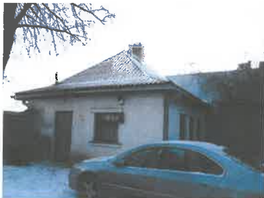
1 pav. Pastato 1B1p fasado fragmentas