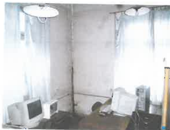
12 pav. Patalpos fragmentas