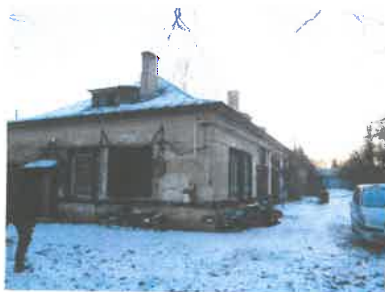
8 pav. Pastato 2C1p fasado fragmentas