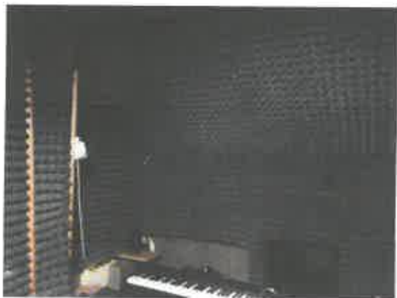
5 pav. Patalpos fragmentas