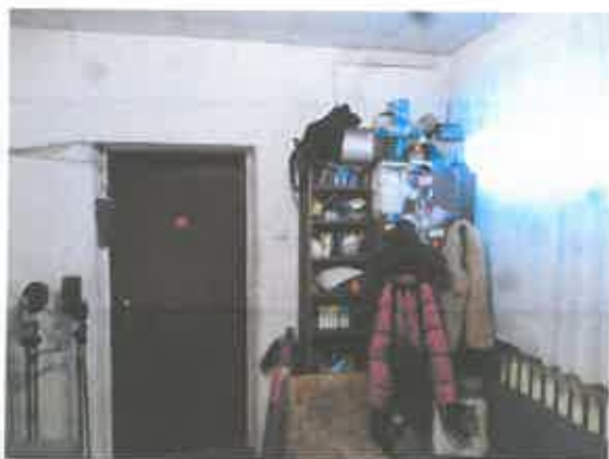
3 pav. Patalpos fragmentas