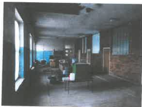
9 pav. Patalpos fragmentas