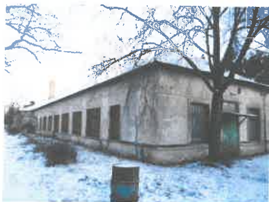
7 pav. Pastato 2C1p fasado fragmentas