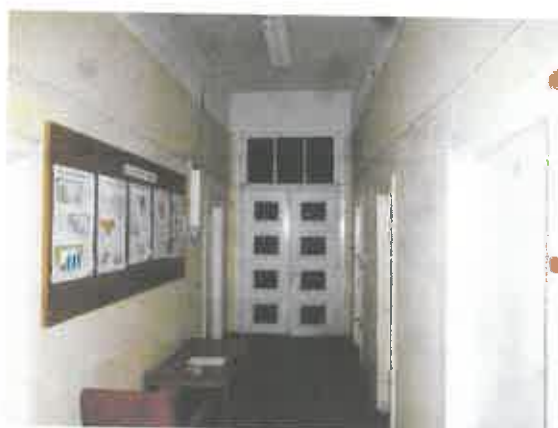
11 pav. Patalpos fragmentas