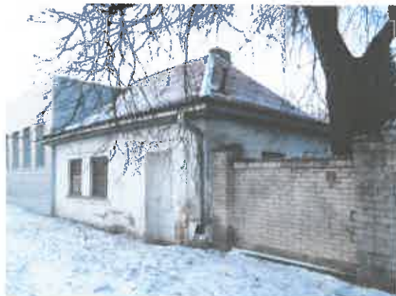
2 pav. Pastato 1B1p fasado fragmentas