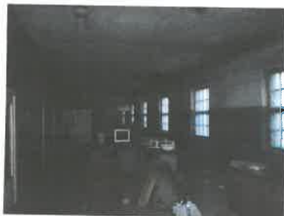
10 pav. Patalpos fragmentas