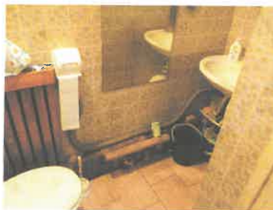
6 pav. Patalpos fragmentas