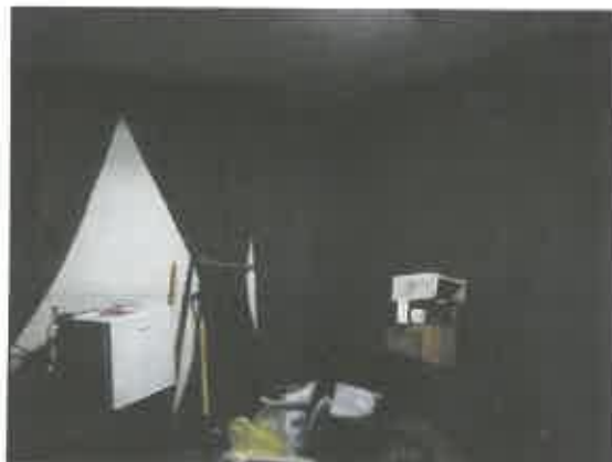
4 pav. Patalpos fragmentas