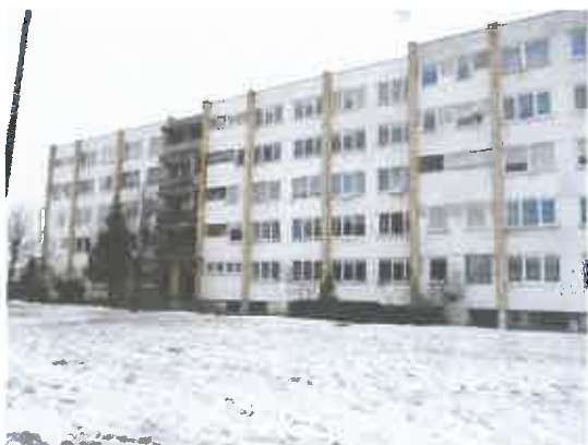
1 pav. Pastatas 1N5p, kuriame yra vertinamas butas

Buto/patalpos - kambario unikalus Nr. 4400-1008-4330:1578, esančio Kauno r. sav. Akademijos mstl. Universiteto g. 2-522A,, fotonuotraukos