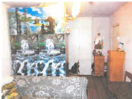
3 pav. Kambario fragmentas