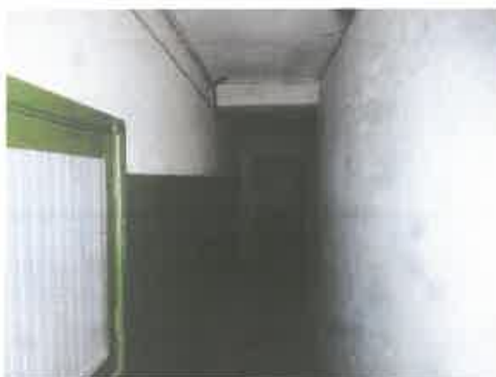
4 pav. Laiptinės fragmentas