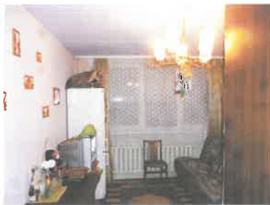
2 pav. Kambario fragmentas