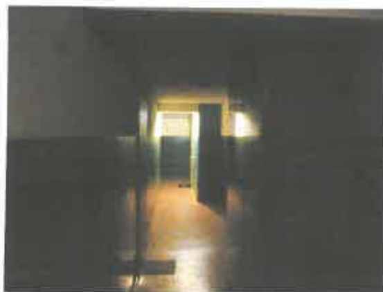
4 pav. Laiptinės fragmentas