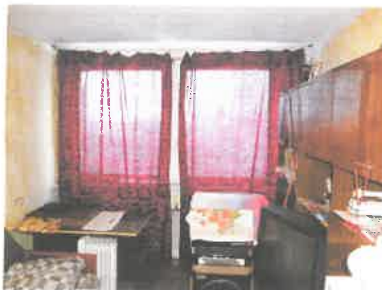
2 pav. Kambario fragmentas