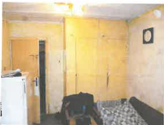
3 pav. Kambario fragmentas