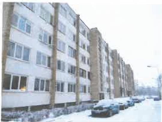
1 pav. Pastatas 1N5p, kuriame yra vertinamas butas

Buto/patalpos - kambario unikalus Nr. 4400-0994-0552:9149, esančio Kauno r. sav. Akademijos mstl. Universiteto g. 2-515,, fotonuotraukos