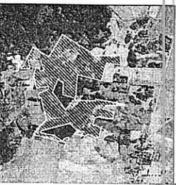
Žemės sklypo išsilymo schema