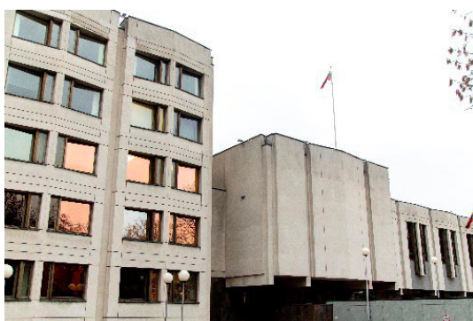
Nuotrauka: Vyriausybės rūmai

Vyriausybės rūmai yra Vilniuje. Vyriausybės rūmų adresas yra Gedimino prospektas 11.